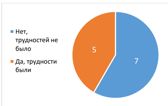
Рисунок 1 – Распределение ответов муниципальных координаторов на вопрос «Столкнулись ли Вы с какими-нибудь трудностями при проведении мониторинга?», чел.