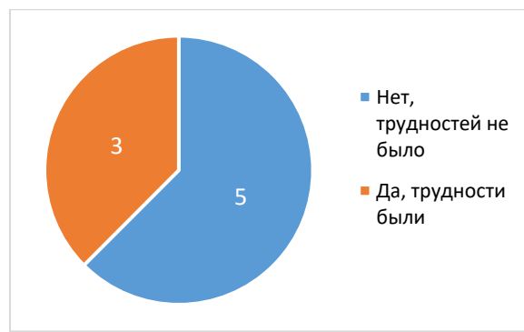
Рисунок 2 – Распределение ответов региональных координаторов на вопрос «Столкнулись ли Вы с какими-нибудь трудностями при проведении мониторинга?», чел.

В рамках проведенной апробации наиболее сложными оказались процедуры проведения экспертных выездов. Причем, наибольшие сложности они вызвали у представителей школ – 7% школьных координаторов выбрали вариант ответа «очень сложно» (рисунок 3). При этом вариант оценки «совершенно легко» выбрало 70% школьных координаторов и 30% экспертов.